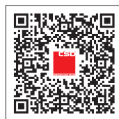
友昌国际官方微博