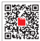
友昌国际官方微信

友昌国际现拥有商业规划师、建筑设计师、商业空间设计师、工程技术人员、管理人员及其他专业人员近100人。友昌国际以服务和质量致胜于市场，实施并运行了ISO9001全面质量管理体系，为商业地产的发展注入了科学、规范并蕴含高附加值的设计理念。